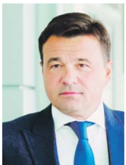
Андрей Воробьев, губернатор Московской области:

На территории ОЭЗ «Кашира» строится завод экологичной гофроупаковки