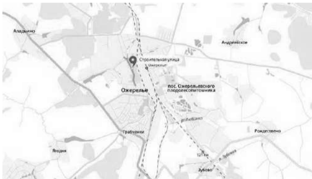
Приложение 3 Фотоматериалы Лот № 1