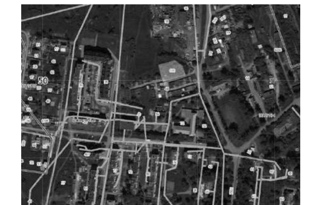
Приложение 4 Лот № 1